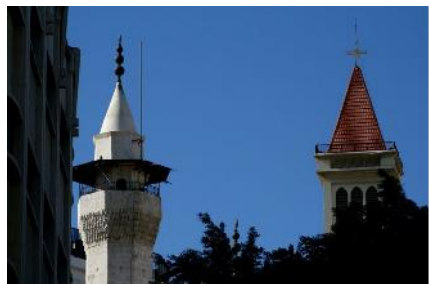
Los lugares de culto religio son semejantes

Toda esta dinámica influye en la renovación de los regímenes jurídicos et en la jurisprudencia islámica para hacer más fácil su aplicación y, sobre todo, abortar las falsas “fatuas” (pronunciamientos) pronunciadas por los integristas y fanáticos.