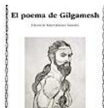
El origen de todo: el “Poema de Gilgamesh” y los

http://periodistas-es.com/la-sexta-noche-contra-pablo-iglesias-turrión-10483