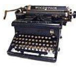
Crisis humanitaria, expresión válida en español