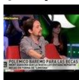
“La sexta noche”, contra Pablo Iglesias Turrión