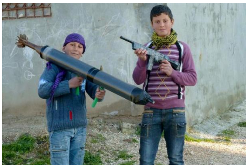
Los rostros inocentes de la guerra civil en Siria

Libia, Siria, Yemen, Sudan y Somalia por ISIS y Al Qaeda. Ni siquiera la vecina Kenia se ha salvado de la quema. Todo se hace en nombre del integrismo islámico que se asocia a la violencia religiosa y tribal sin respeto de las fronteras ni de las reglas de convivencia entre seres humanos. En el fondo, se trata de una lectura política del islam que se aleja de sus valores que privilegian la tolerancia, la fraternidad, la reconciliación y la igualdad.